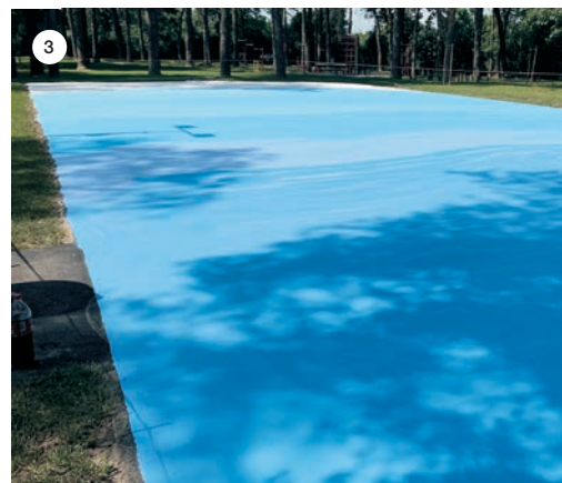
SLIKA 3: Pripremljena podloga prije nanošenja MAPECOAT-a TNS COLOR.