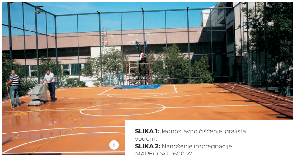
SLIKA 1: Jednostavno čišćenje igrališta vodom.

Nakon sušenja temeljnog premaza nanesen je MAPECOAT TNS FINISH u atraktivnoj narančastoj boji. Korištenjem MAPECOAT-a TNS FINISH osigurava se relativno mekan osjet pod nogama. S obzirom