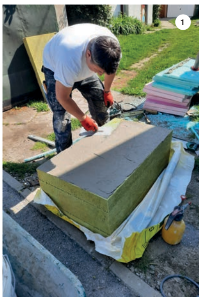
SLIKA 1: Nanošenje sloja MAPETHERM ADHESIVE.

rom na to da je objekt jako razveden i da se nalazi na rubu brijega, investitor je debljom toplinskom izolacijom želio osigurati minimalnu potrošnju energije. U kombinaciji s dizalicom topline tako će imati konstantnu i ugodnu temperaturu u unutarnjim prostorima s minimalnim gubicima i smanjenim ciklusima dogrijavanja zraka zimi, odnosno hlađenja ljeti. Za lijepljenje toplinsko-izolacijskih ploča korišten je MAPETHERM ADHESIVE, jednokomponentni cementni mort koji odlikuje prionjivost viša od 1,5 Mpa i tlačna čvrstoća od 13 MPa.