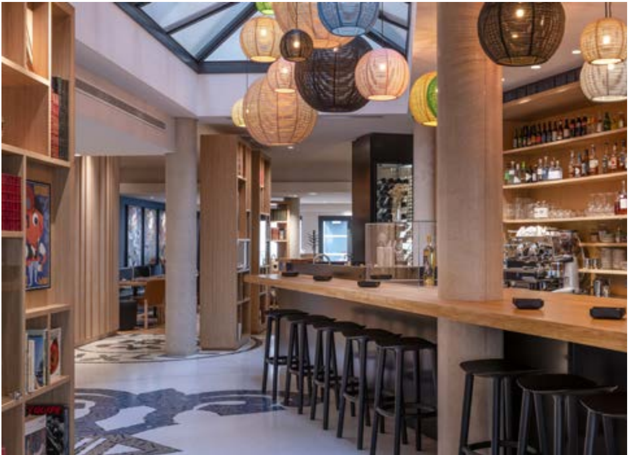
▲ Le défi technique relevé par CMB : une finition parfaite entre les différentes teintes de terrazzo