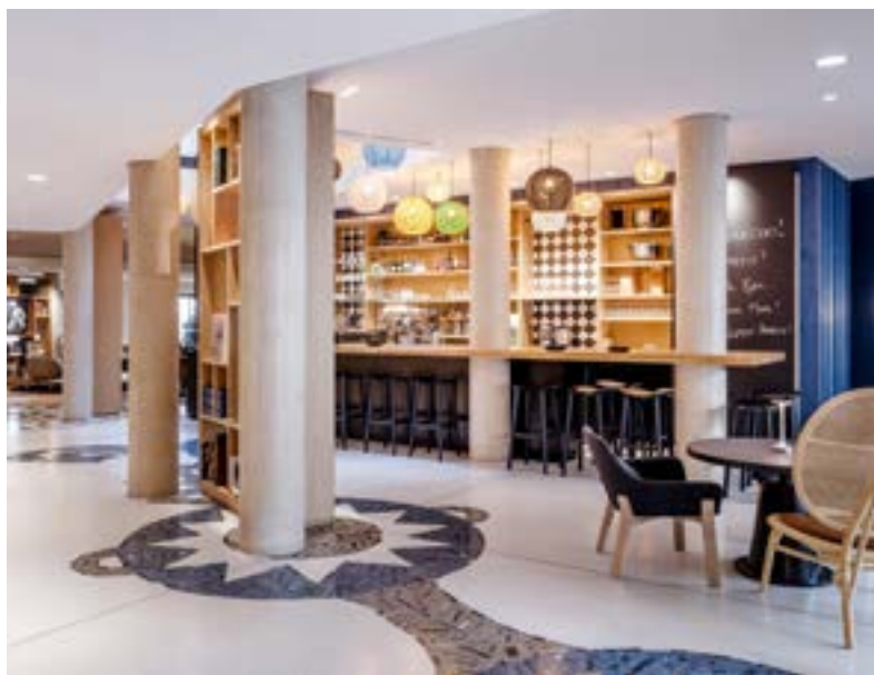
▲ Les symboles sont inspirés des stèles funéraires basques

Dans les espaces intérieurs, les voyageurs sont invités à découvrir le Pays Basque. Le parquet en chêne massif est posé en échelle « à la bayonnaise », typique des habitats de la ville. Les textiles, rideaux et coussins sont en tissus basques, signés de la Maison Jean-Vier. Dans les chambres, des reproductions de tableaux de maîtres bayonnais habillent les murs pour une décoration élégante et personnalisée. Et dans le hall d'accueil, un magnifique sol en terrazzo laisse entrevoir des symboles basques habilement incrustés.