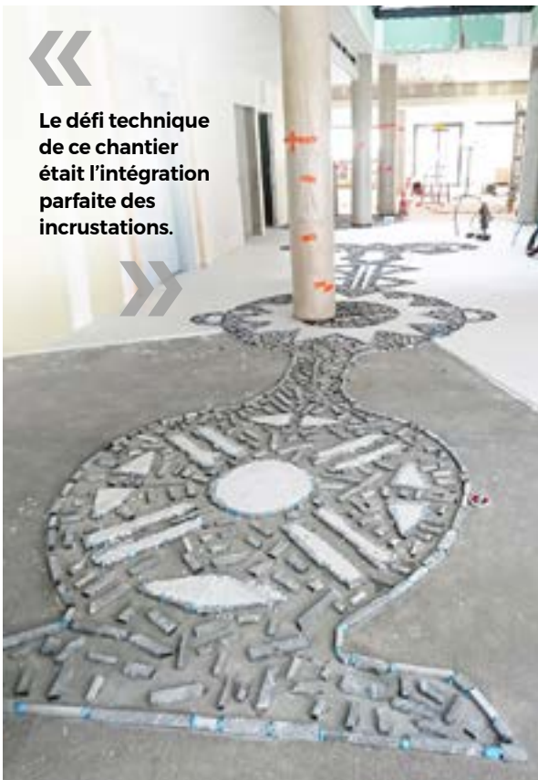
▼ Un travail minutieux d'intégration des incrustations

« Le défi technique de ce chantier était l'intégration parfaite des incrustations. »