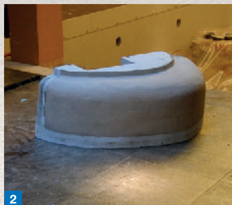
Foto 3. Fase di montaggio degli elementi di polistirolo sulle colonne.