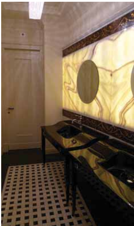
SOPRA. Nei bagni della hall le lastre in marmo sono state incollate con ELASTORAPID a doppia spalmatura.