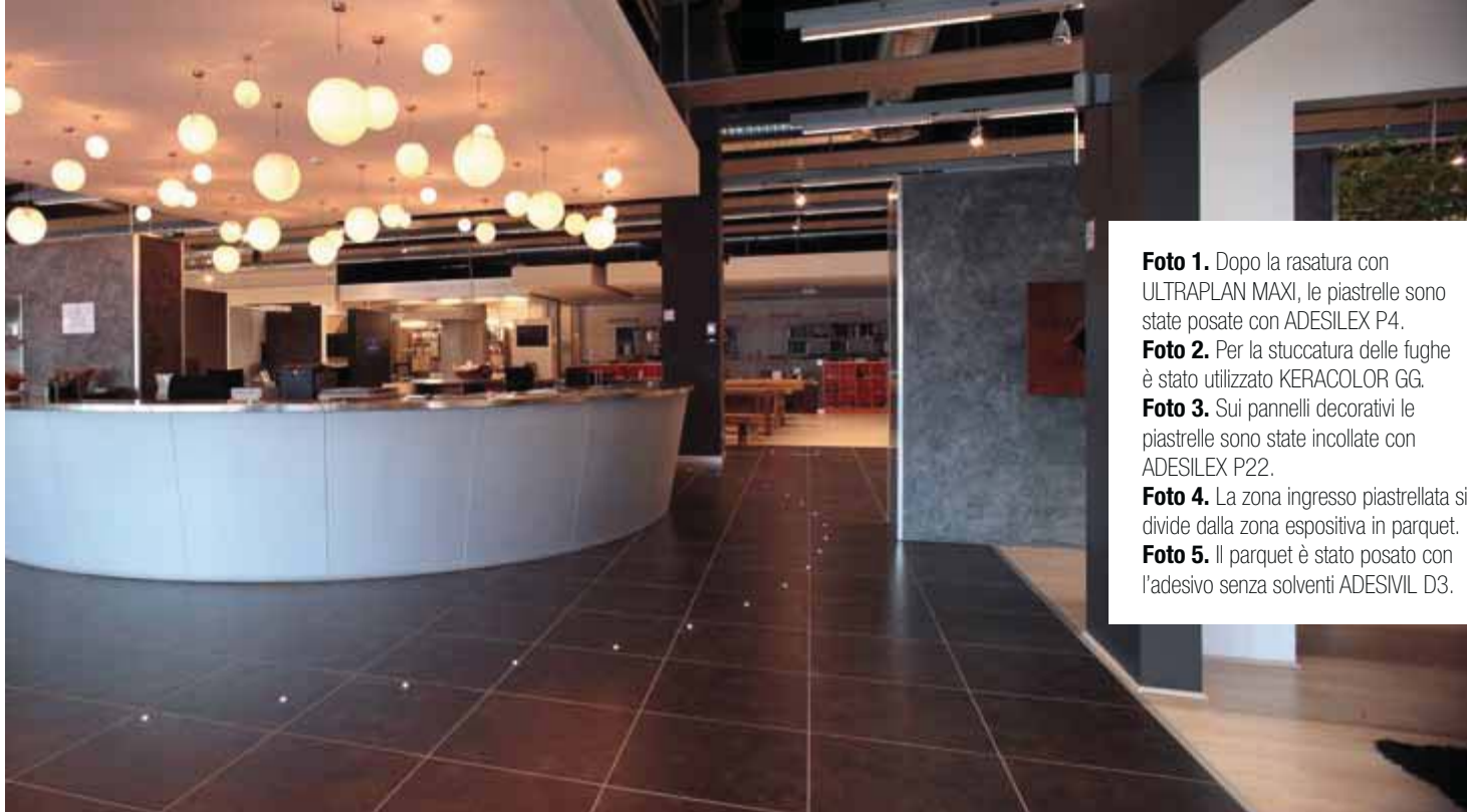
Foto 1. Dopo la rasatura con ULTRAPLAN MAXI, le piastrelle sono state posate con ADESILEX P4.

Foto 2. Per la stuccatura delle fughe è stato utilizzato KERACOLOR GG.