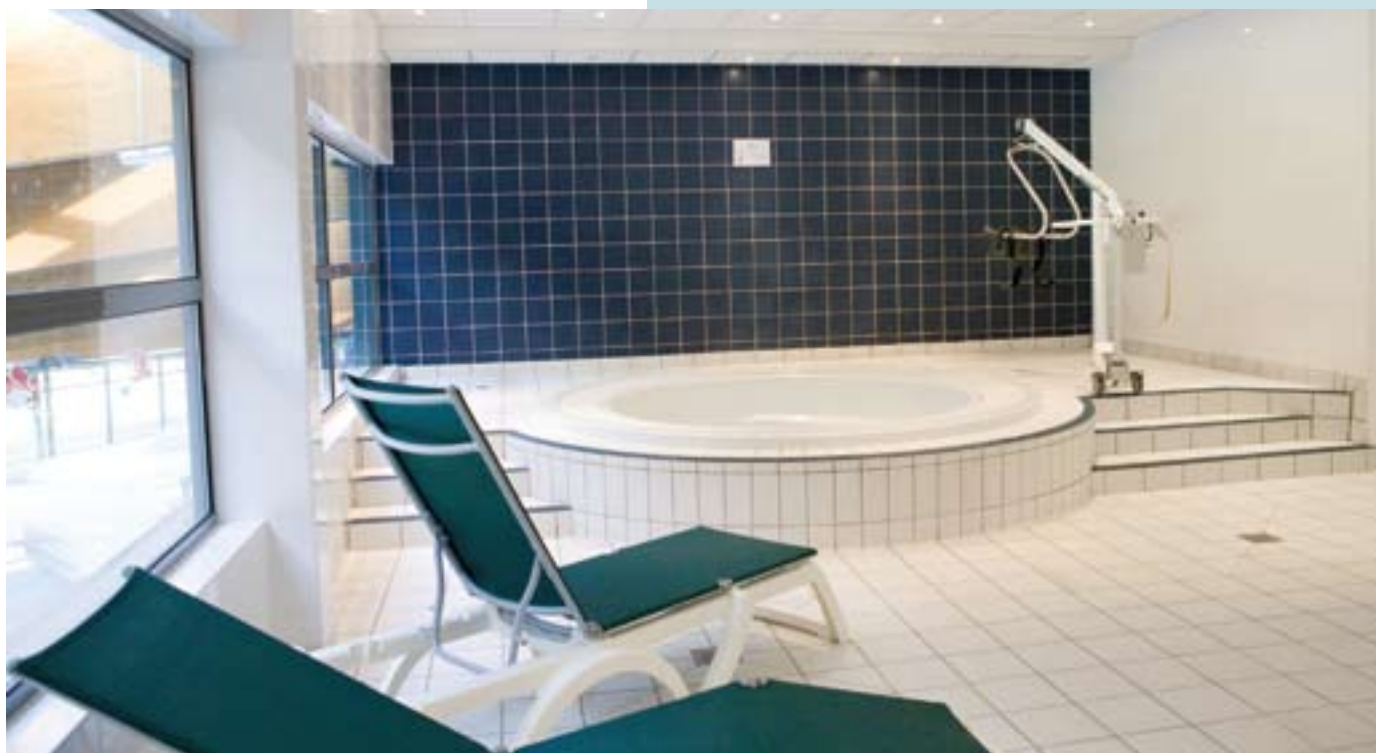
▲ L'espace Balnéo

Après un séchage de 24 heures, le jointoiment a été réalisé avec Keracolor GG n°113 (gris ciment), mortier pour joints de 4 à 15 mm. Keraflex S1 et Keracolor GG n°113 bénéficient de la technologie Dust Free qui réduit de 90% les dégagements de poussière pendant son utilisation, pour un chantier plus propre et plus agréable.