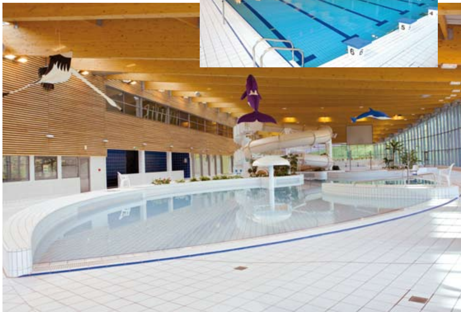
▲ Le bassin ludique, un paradis pour les enfants !