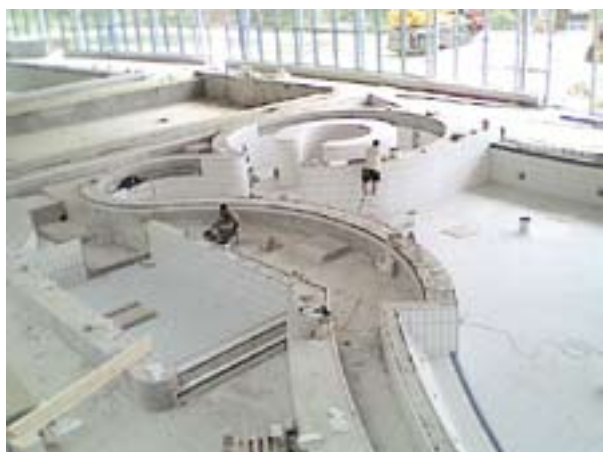
▲ Le collage des carreaux dans le bassin ludique