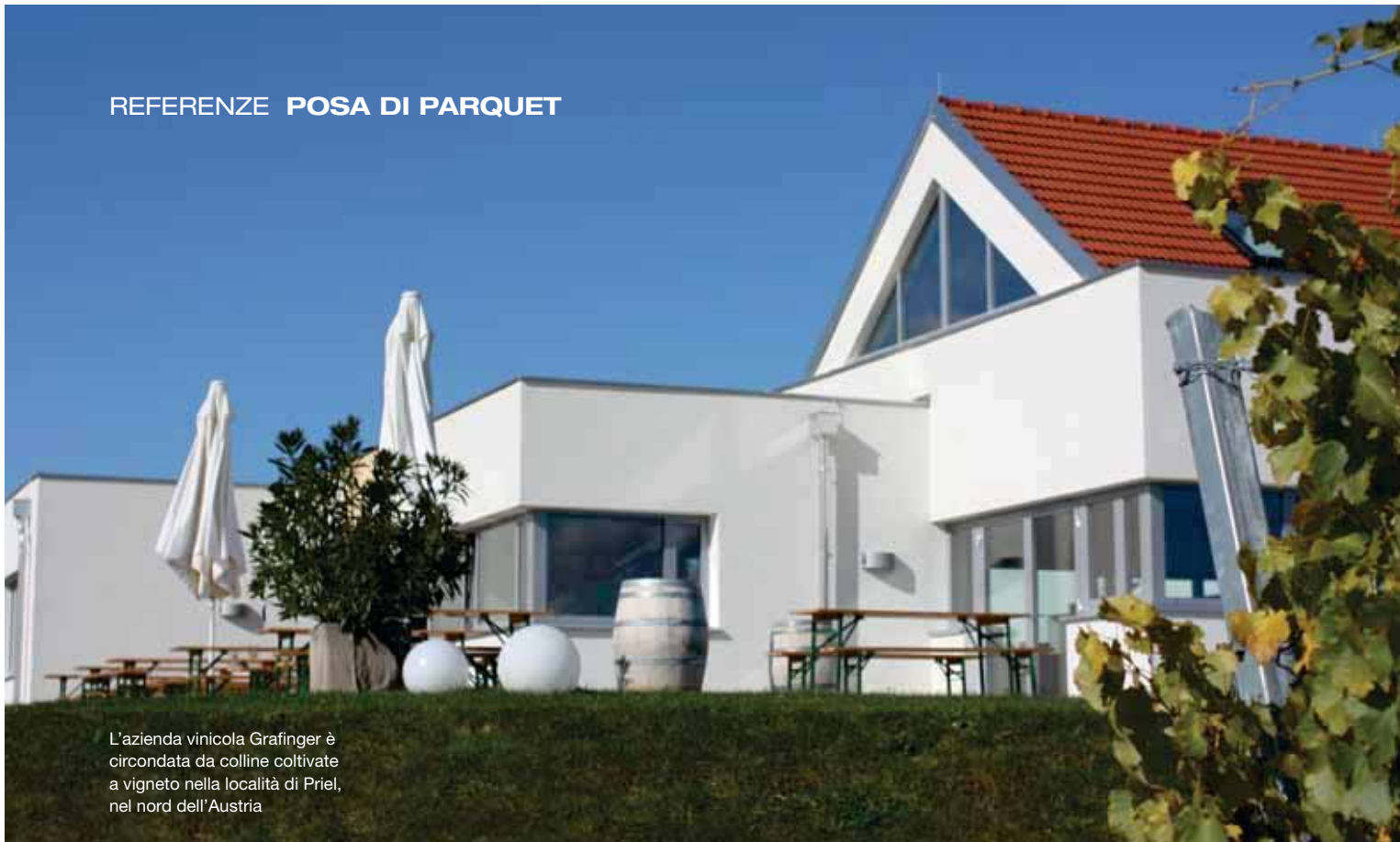
L'azienda vinicola Grafinger è circondata da colline coltivate a vigneto nella località di Priel, nel nord dell'Austria