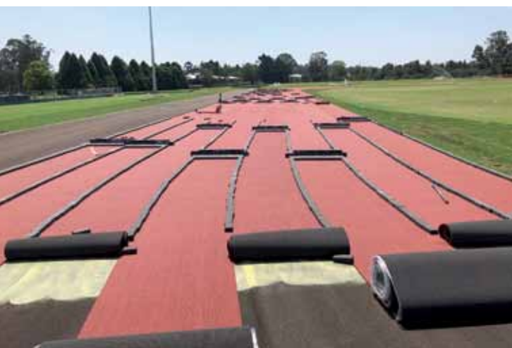
La posa della pista, dopo la rasatura delle superfici, è stata effettuata con ADESILEX G19.