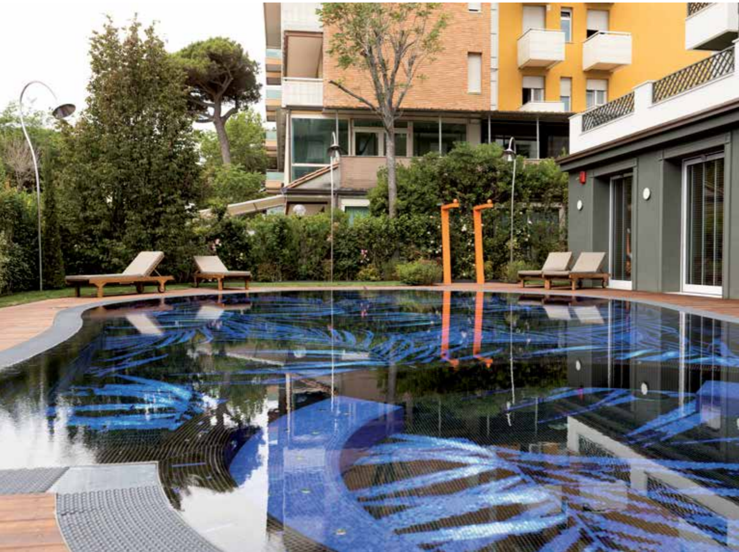
IN ALTO. Il mosaico della consociata Mosaico+ (che ha realizzato un decoro personalizzato) è stato posato nella piscina con l'adesivo cementizio ULTRALITE S1.