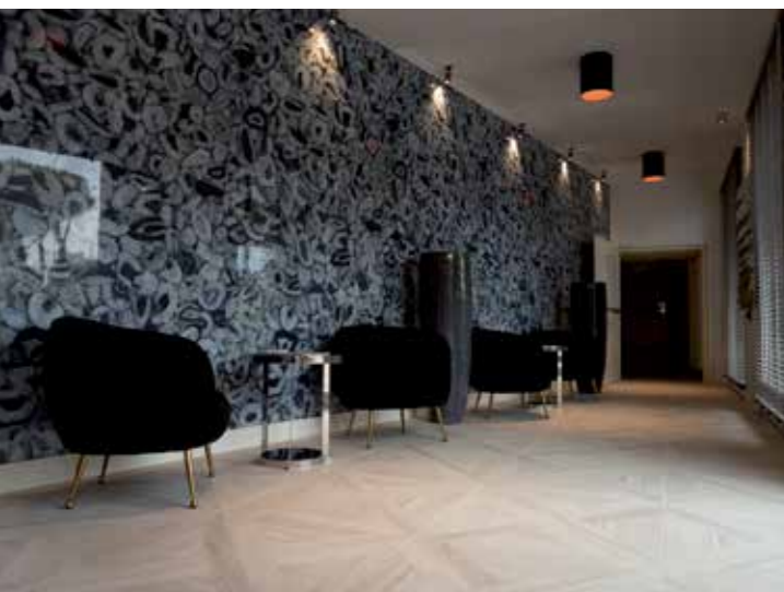
A SINISTRA. Nel corridoio che collega le due strutture, sulle pareti sono state posate grandi lastre di Fiandre (formato 150x320) utilizzando l'adesivo ULTRALITE S1. A DESTRA. Nella zona wellness, le pavimentazioni sono state realizzate con piastrelle di grande formato, posate con KERAFLEX EASY S1.